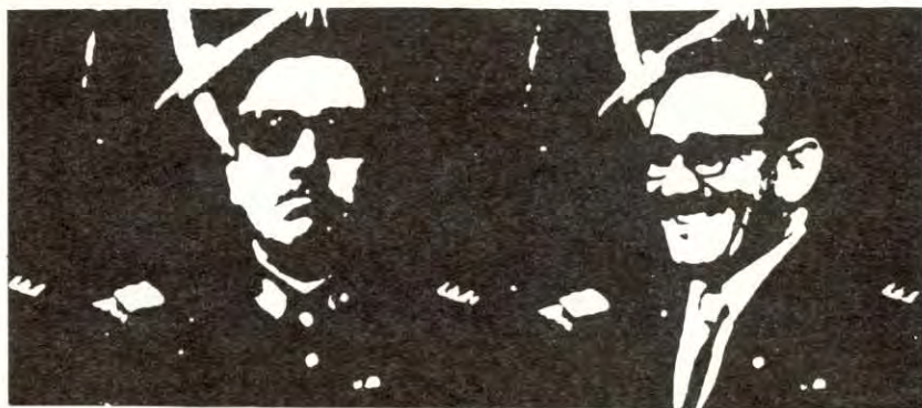
Chiles Pinochet og USA's Kissinger i skjønn forening.