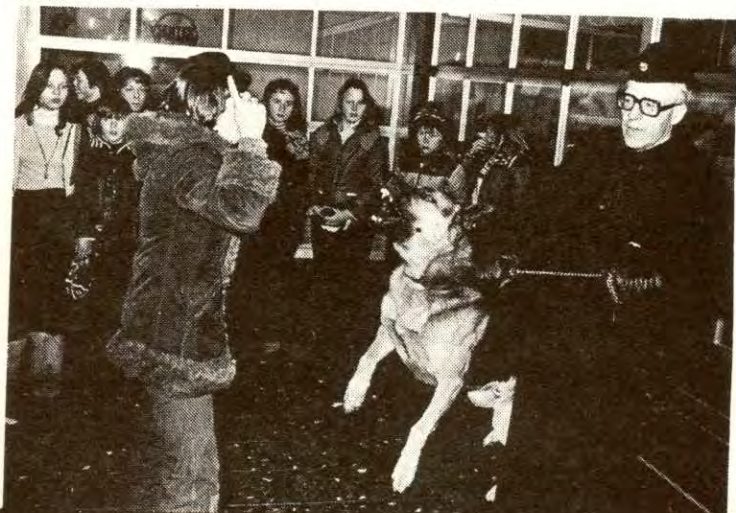
Bildet er tatt like før den gletsjende blikkja sitter i armen på jenta.

- Jeg håper det. En av hovedparolene til Faglig 1. mai Front er jo nettopp "Kamp mot politivolden". Det er det mangeljer opp som er enig i. Vi har jo fått merke hva det vil si å bli terrorisert, selv om vaktene her opp ikke akkurat er purk.