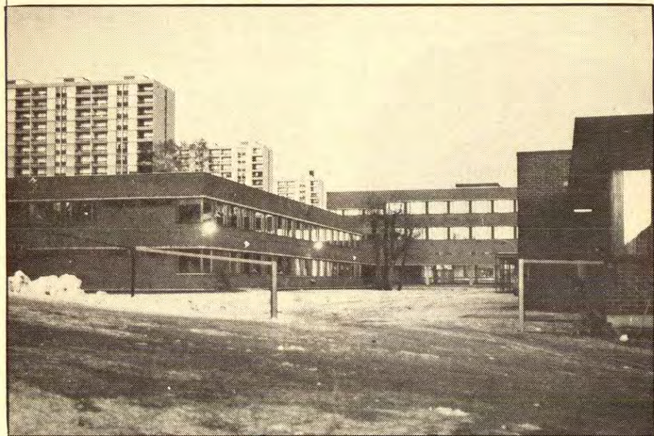
Bildet: Dette er Linderud ungdomsskole som nå skal bli gymnas. Rett over veien ligger Linderud barneskole som er iferd med å gå over til ungdomsskole og barneskole i ett-en 1-9 skole.

UREDD har vært å besøkt Linderud 1-9 skole i Oslo. Skolen har bare vært 1-9 skole siden begynnelsen av dette skoleåret, så den viser ikke fullt ut hvordan 1-9 skolen er. Men den gir oss allikevel en pekepinn på hvordan 1-9 skolen vil komme til å bli.