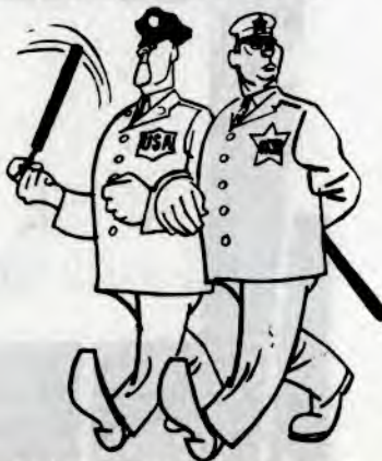
USA og Sovjet som »verdenspolitikk»

– Sovjet gir ikke rentefrie lån til u-landa som Kina gjør. Derimot inneholder Sovjets avtaler ofte bestemmelser om at u-landet må bruke lånet til kjøp av sovjetiske varer. I 1971–72 fikk India 223,5 millioner rupier i lån fra Sovjet, men i samme tidsrom måtte landet betale tilbake 409,1 mill. rupier i avdrag og renter på tidligere lån til Sovjet.