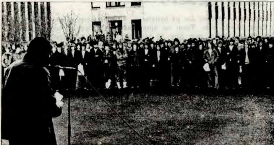
Fra streikemøtet i skolegården.

I Oslo er det forsøk med »toårig videregående» skoler. Det er en oppfinnelse sprunget ut av »Steen-komiteen» – en komite som har laget lange utredninger om hvordan hele skolesystemet etter ungdomsskolen skal være i framtida. Til sammen er det flere enn 100 elever i Oslo som går på den nye forsøkskolen. Det er bra det drives forsøk, vi er sannelig ikke fornøyd med de skoletilbud som finnes. Men vi må jo spørre oss sjøl hva disse skolebyråkratene mener med forsøk, når følgende skjer: Mange av disse linjene på det toårige videregående kurset gir ingen som helst kompetanse. (Kompetanse er noe som gir deg muligheter til å utdanne deg videre, eller få jobb. Eks.: Handelsskole gir deg kompetanse til å få en kontorjobb. Gymnasene gir deg kompetanse til å begynne på universitetet osv.) Har du f.eks. gått sosiallinje på den toårige skolen – har eksamenspapirene du da