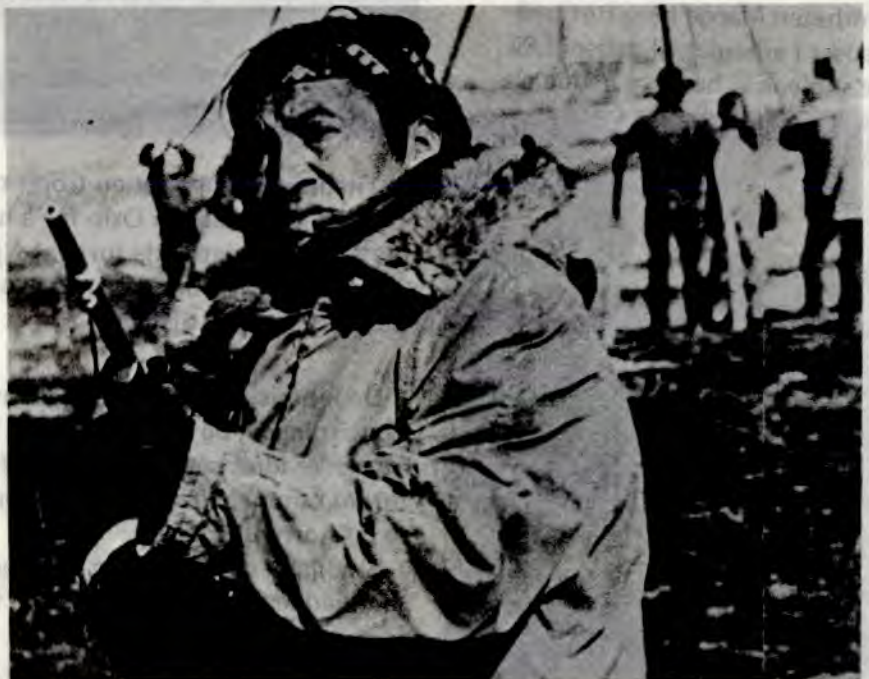
Springende Bjørn holder vakt i Wounded Knee.

Den 29. februar gikk over 200 indianere til okkupasjon av landsbyen Wounded Knee i Pine Ridge-reservatet i Nord-Dakota. Reservatet er