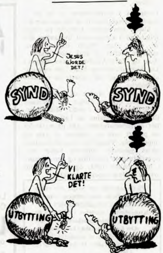
Den øverste tegningen er tatt fra »Livets brød», en avis utgitt av ei gruppe som kaller seg »Guds fred».

Det er klart at folk som er kristne godt kan bli medlemmer av Rød Ungdom. Det er kristne som er medlemmer og det går bra fordi det er mange saker vi er enige om og som vi kan kjempe sammen om. Men vi tror ikke at det finnes noen gud som løser problemene for oss, så i den grad kristendommen er et hinder for å reise folk til kamp for sine krav må vi bekjempe den.