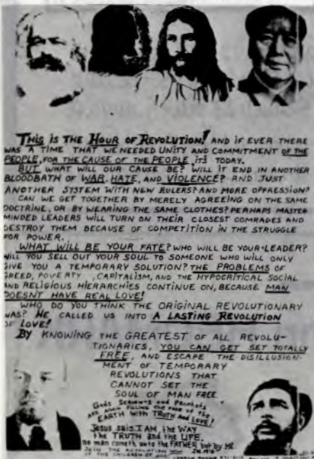
Denne løpeseddelen har Children of God laget. Den er på engelsk.

»Kapitalisme og maktsyke vil ikke komme til å forsvinne fordi menneskene ikke elsker hverandre. Men ved å bli kjent med den største av alle revolusjonære – Jesus – kan man fri seg fra de problemene som dette samfunnet skaper.» Dette står i en løpeseddel som Children of God har gitt ut.