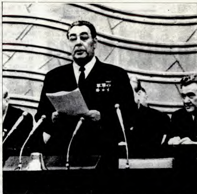
Partisjef Leonid Bresnjev taler.

I dette nummeret av Røde Garde vil vi ta opp Sovjets utenrikspolitikk.