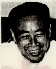
Kamerat Chou En-lai

Når man er i Albania hører man ofte små korte historier med brodden rettet mot Sovjet-revisjonismen. Her følger en som vi synes det er verd å bringe videre.