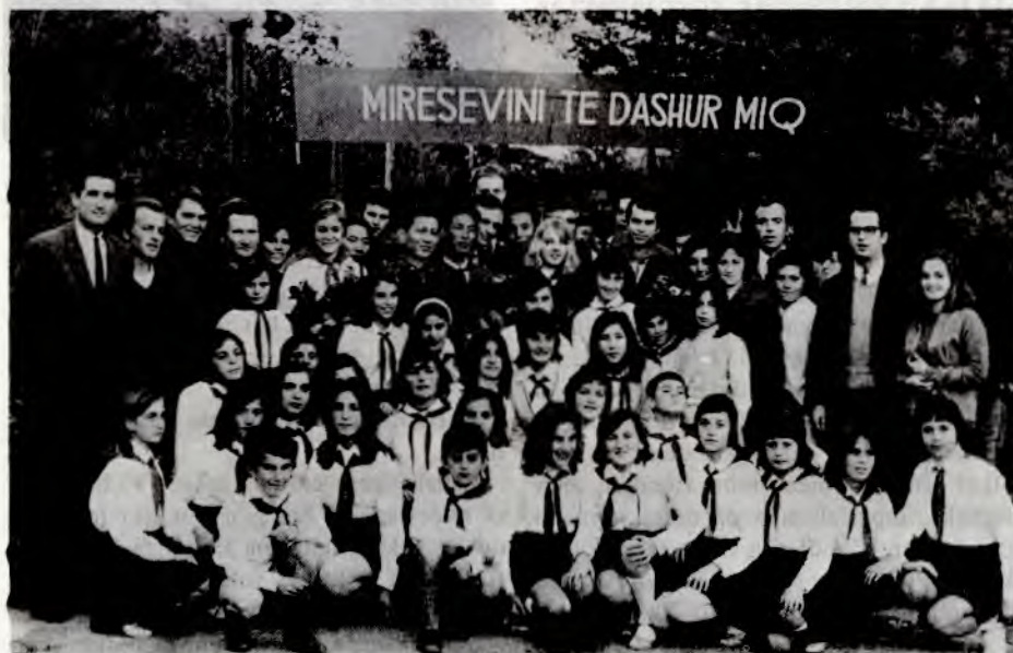
Noen av de utenlandske delegatene til kongressen

Delegatene dro hjem med mengdevis av erfaringer og ideer som de skulle bringe videre til kameratene på hjemstedet. Kongressen lofte folket og partiet at de skulle arbeide hardt for å forsvare hver seier det albanske folket inntil nå hadde oppnådd, og sette alt inn på å vinne nye seirer på veien fram mot kommunismen. Det er en stor inspirasjon å vite at dette skjer i vår egen verdensdel, Europa. Albania er et land vi kan sammenlikne oss med på mange måter. Et lite folk i et lite land med karrig natur, men store ressurser viser oss at det er mulig å bekjempe imperialismen og revisjonismen. De beviser at det er mulig å bygge sosialismen og berge seg sjøl. Deres erfaringer er verdifulle for oss, deres eksempel er en stor inspirasjon.