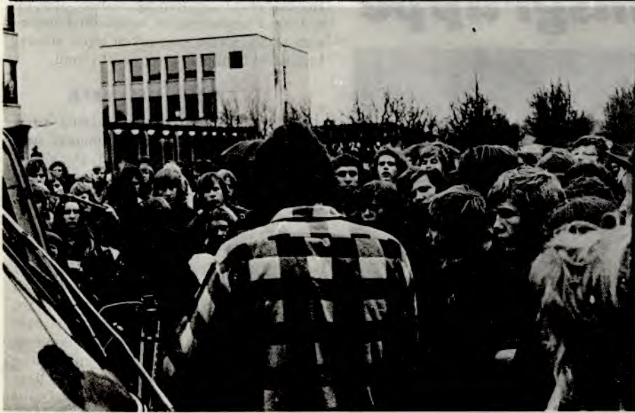
Aksjon på Oslo Yrkesskole, Sogn.

12. desember gikk samtlige elever, med støtte fra lærere, rektor og funksjonærer til aksjon for å få det velferdsbygget kommunen vedtok å bygge for snart 10 år siden.