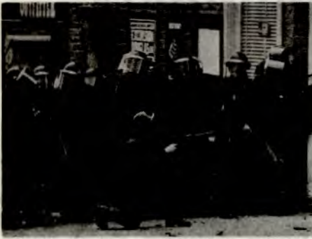
Over: Britiske spesialtropper i Nord-Irland.

Under: Et vindu i en bydel av Belfast som heter Bogside. På plakatene står det bl.a.: Ut med de britiske troppene, ikke gi dem noe te, noe glede, noe håp. Vi støtter IRA!