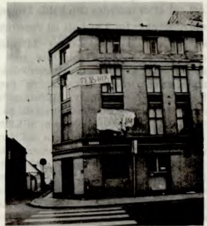
UNGDOMMENS HUS Hausmannsgt. 26

RØD UNGDOM-serien kommer med et nytt hefte om "et sted å være"-aksjoner og spørsmålet om å bygge ungdomsfront.