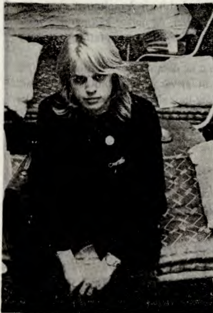
I år ble flere fra yrkesskolen nøddinnkvartert.

– Hva gjør du i fritida? – Jeg liker faget mitt som er foto, og det driver jeg en del på med. Og så har jeg jente i byen, og vi går ut av og til, men alt er dyrt i Oslo så det blir ikke så mye av det. Jeg er også med i bygdelaaget og vi har en hytte i Lommedalen som vi drar opp til en gang imellom. – Driver du med noe politikk? – Ja, jeg deltar i FNL gruppa på skolen.