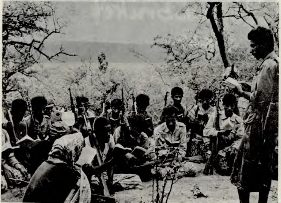
Palestinske geriljasoldater studerer Maos skrifter.

som skaper historia – også Palestinas frigjøring.