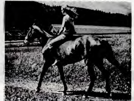
«Bud-avisen» er en avis som gir til alle budene sine.