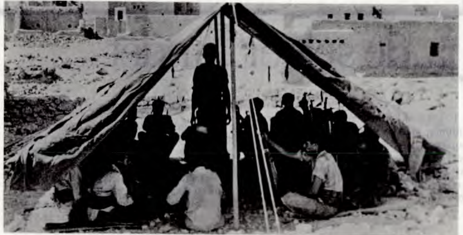
Geriljasoldater har møte med lokalbefolkninga i en landsby.

Regjeringa var taus i september 1970 da 3400 palestinere ble drept og 8000 såret av det jordanske quislingregimet etter oppdrag fra USA og Israel. Og de er tause i dag da israelske fly terrorbomber landsbyer og flyktningeleire. Regjeringa solidariserer seg med undertrykkerne. Beklagelsen over de døde i München blir en skammelig oppvisning i dobbelt-moral og hyklери.