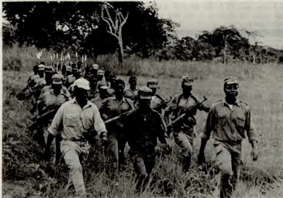
Soldater fra frigjøringshæren i Mozambique

Vi m-lere og mange andre kjempet imidlertid på landsmøtet for at støtten