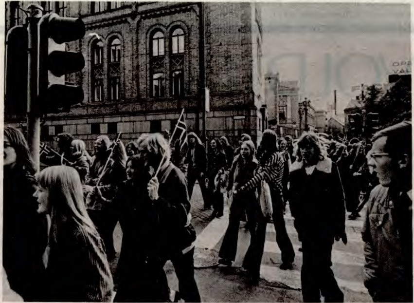
Ungdom feirer seireren i Oslos gater.

Vi er altså ikke ferdig med EEC-kampen. Vi er nødt til å holde sammen og forsvare resultatet av avstemningen. Skal vi greie det, må vi også få med oss en stor del av de som i denne omgangen har stemt ja. Det er derfor av avgjørende betydning at vi som tilhører flertallet under folkeavstemningen ikke viser fiendtlighet og hovmot overfor folk som har stemt ja. For et valg og en avstemning under kapitalismen er litt av en farse. Vi vet at ledere i Øst-Europa klarer å få så godt som hele folket til å stemme på seg, til tross for stor misnøye med dette lederskapet. Vi vet at folkefiendtlige ledere som Nixon og andre også får store deler