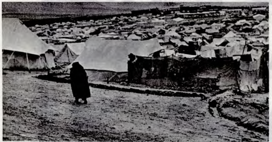
Slik har 1,5 mill. palestinere bodd i 25 år.

Staten Israel ble opprettet på det palestinske folkets jord i 1948. Halvparten av folket ble da fordrevet fra sitt hjemland, og har nå i 24 år levd som flyktninger under umenneskelige forhold. Staten Israel har seinere fortsatt sin ekspansjon på andre folks territorium, bl. a. ved aggresjonskrigene i 1956 og 1967 som begge ble startet av Israel. Israel har tredoblet sitt territorium, og nye hundretusener palestinere er blitt drevet på flukt. I dag er ca. 2/3 av det palestinske folket drevet hjemmefra. Den resterende del, som fortsatt bor i Palestina, lever under politisk og militær kontroll – som annenrangs borgere i sitt eget land. Den israelske regjering arbeider uavbrutt for å realisere det sionistiske målet – en rein jødisk stat, fri for det folk som har bodd og livnært seg i landet i hundrer av år.