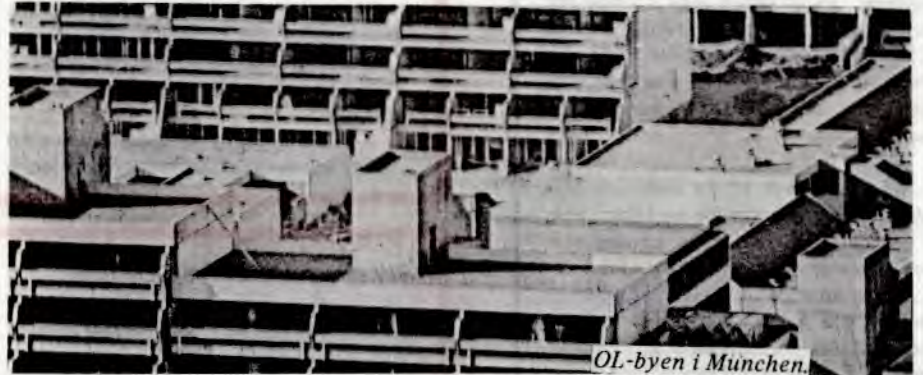
OL-byen i München.

– Jeg har ikke noe imot konkurranser i seg selv, men jeg er imot at alt som er av midler rettes inn mot seier i de store internasjonale konkurransene. Vitsen med konkurranser må være at de får flere folk til å drive idrett.