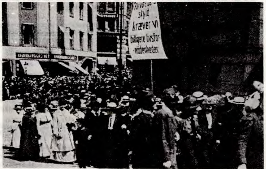
Dyrtidsdemonstrasjon i Oslo i 1917.

»Er det bønderne i Odda dei meiner aa trælbinde under Folkets hus, eller kor langt hev dei tenkt magtumraadet skal rekka? Vil socialisterne i Odda diktera pris og salsvilkaar for mjølk fraa heile Hrdaner, fraa Jæren, Ryfylke og umlandet til Bergen? At dei hev hug til det er lett aa skyna. Men magt? – Du store stakkarsdom! Vilde bønderne bry seg um dette