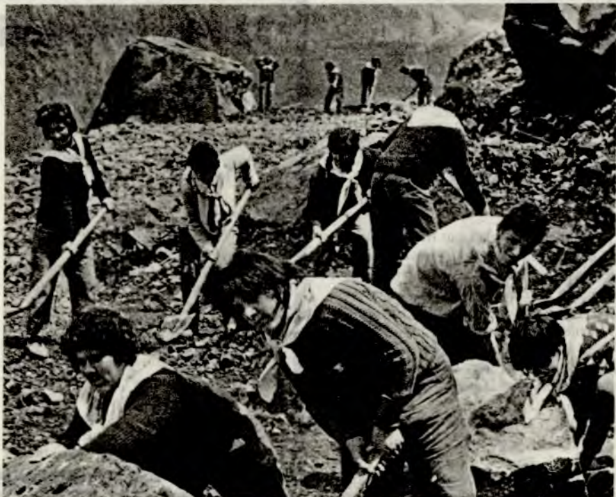
Ungdommen bygger ut jernbanenettet!

I albanske skoler er disiplinproblemer så og si en ukjent ting. Vi snakket med en lærer på en middelskole (tilsvarende ungdomsskolen), og fortalte ham om problemene i norsk skole. Hadde de noe lignende? Han tenkte seg lenge om før han svarte. »Vi hadde visst noen små problemer for en tid tilbake. To elever sluntra unna leksene, av og til skulka de, på fabrikkens jobba de dårlig. Elevenes kamerater i Ungdomsforbundet tok problemene opp med disse to. De diskuterte med dem, kritiserte dem og fikk dem til slutt til å forstå at ved å skulke skolen og sluntre unna leksene, så skadet de folket og seg selv. Det å sette sine egne interesser fremst er en arv fra det gamle samfunnet. Det dukker opp av og til, og det blir tatt svært alvorlig. Gjennom grundige diskusjoner, kritikk og sjølkritikk klarer vi som regel å løse problemene.»