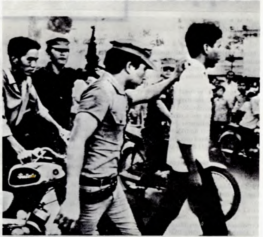
Ungdommer hentes av militærpoliti i Saigon (8.mai)

STØTT SØR-VIETNAMS PROVISORISKE REVOLUSJONÆRE REGJERING, PRR!