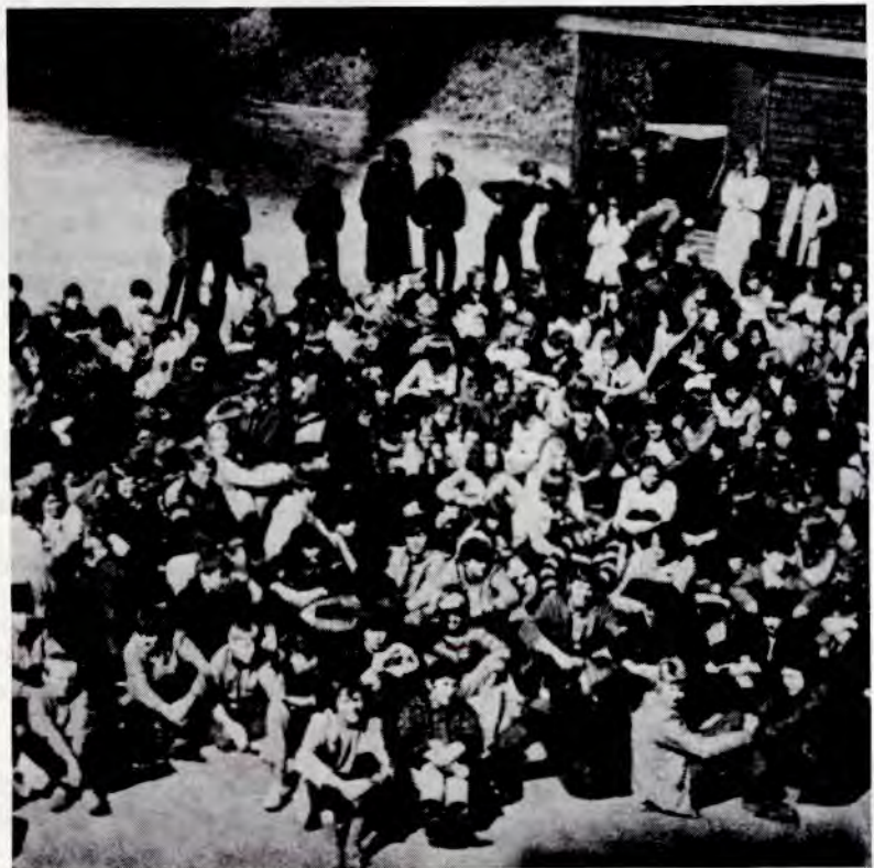
100 elever i hver klasse!

La 1. mai også bli et slag mot Steen-komiteen!