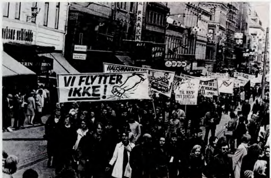
Fra RAF-toget i Oslo i fjor, paroler om kamp mot Hausmannslinja, en motorvei som vil rasere boligstrøk.

RAF har også betydd at folk fra forskjellige deler av kampen har gått sammen i felles tog, noe som har skapt forståelse og solidaritet mellom dem. Her går f. eks. de som solidariserer seg med FNL sammen med folk som kjemper for natur- og miljøvern, studenter og skoleelever sammen med industriarbeidere.