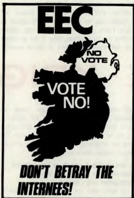
Sinn Feins anti-EEC-plakat — Nord-Irland: får ikke stemme Republikken Irland: Stem nei! Ikke forråd de internerte!

Etterpå uttalte den britiske øverstbefalende at han aldri hadde møtt maken til ungdommer, og håpet at han aldri ville gjøre det igjen.