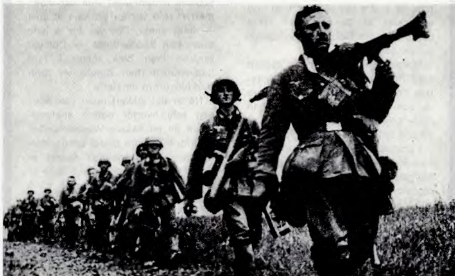
2. verdenskrig. Tysk infanteri rykker fram på Verdun-fronten.

På lengre sikt er det bare en revolusjon der folket overtar styringen av landet som kan fjerne krigsfarene.