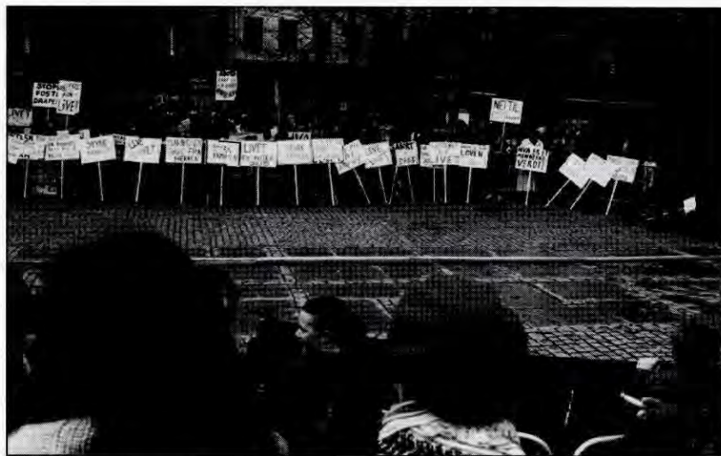
Vi har vunnet kampen om sjølbestemt abort i Norge. Men vi har ikke vunnet kampen for frigjøring. Her fra anti-abortdemonstrasjon i Oslo i 1994.

Et potensialet for at vi skal samle oss i kampen mot porno og prostitusjon, mot stripping og kvinnefiendtlig reklame, mot privatisering og nedbygging av velferdsstaten. Potensialet for nok en gang å reise krav om likelønn og 6-timers dag og for retten til å gå trygt på gata. Tida er inne for å samle oss i kampen for at alle mennesker skal være frie og selvstendige, i kampen for full kvinnefrigjøring! Gratulerer med dagen!