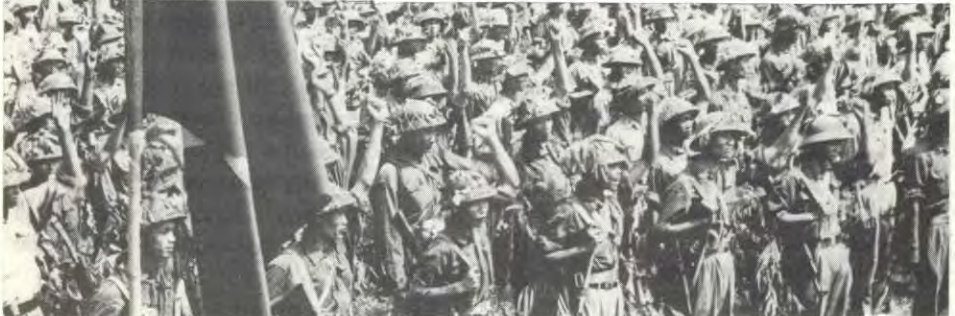
Mao: revolusjon er hovedtendensen i verden i dag