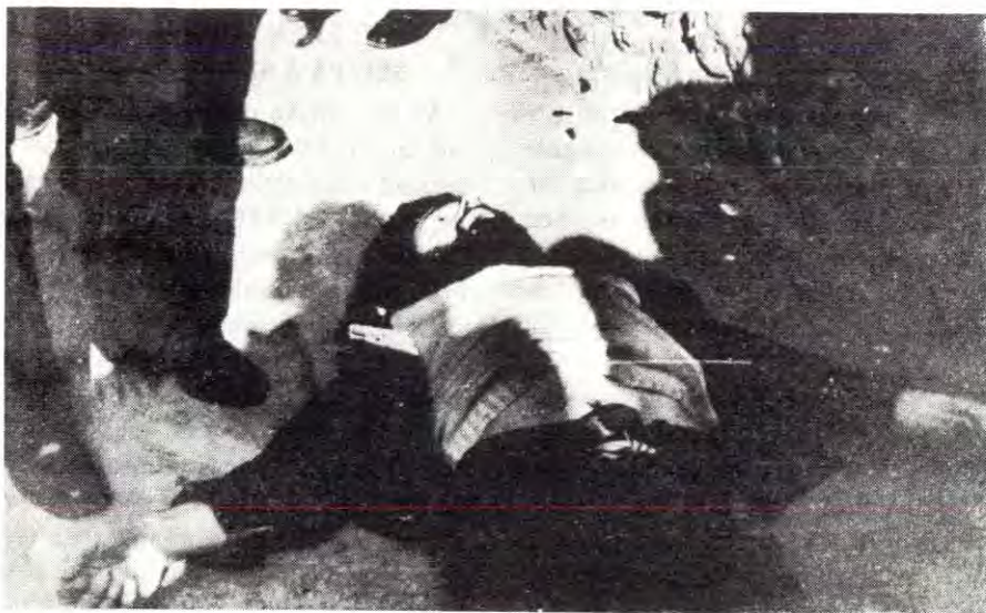
Arbeideren som ble skutt ned utenfor bedriftsporten til Renault-verkene i Paris.

Disse eksemplene er trukket fram for at vi skal kunne se at fienden er vel