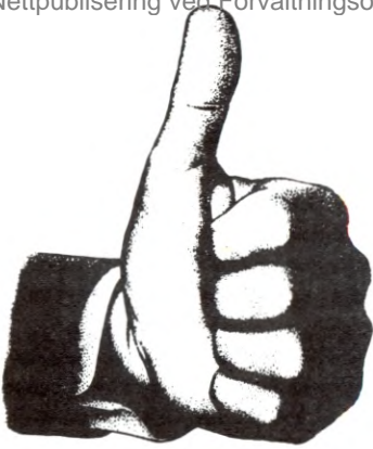
Tommelen opp for nye KK

radikal ungdom og "3.verden"-rørsla. Viktige stikkord for utviklinga av avisa må då bli: