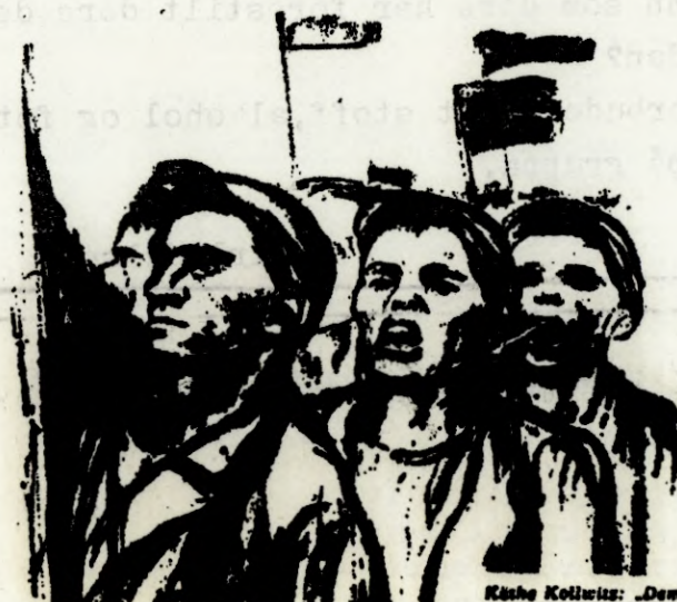
Käthe Kollwitz: „Demonstration“

Begynte de da å klage og skrike for å få noen til å fikse det for seg? Nei, deuskaffa søppelbøtter sjøl. Dette er en bra kommunistisk stil. Vi er ikke passive til- skuere. Vi må tenke tinga rundt oss. Vi må tenke at vi er ei drivkraft, at vi kan forandre tinga rundt oss. Og dette må vi gjøre i praksis her på leiren. Det var det flere gjenger som gjorde i går kveld også. De slo seg ned i tomme rom og spilte og sang. Kamerater, la oss lære noe av disse folkå Ta sjøl initiativ til at dette kan bli en lei- hvor alle finner seg til rette!