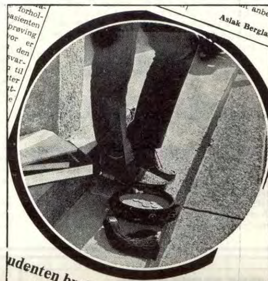
Studenten brukte opp pengene. Det var dyrere å leve enn han trodde. Husien forfalt. Han trengte flere bøker. Han går til DnC og låner fra Lånekassa. Samme dag...

"... Vedkommende departement kan gi bestemmelser om reisestønning, stipend og lån. Departementet kan herunder begrense ordningene, sette aldersgrenser, stille faglige krav, begrense adgangen til å kombinere forskjellig utdanning og sette andre vilkår for stønning, stipend og lån. Statens Lånekasse for studerende ungdom gir nærmere regler om stønning, stipend og lån, og kan herunder gi be-