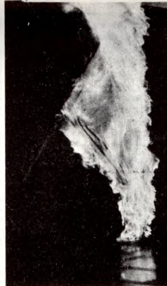
Et sionistflagg blei brent

Anti-imperialister og venner av det palestinske folket blir i disse tider hengt ut som rasister, fascistar og fanatiske ekstremister, for å nevne noe av vokubularet. Borgerpressa kjører leder på leder om fanatiske ekstremister som ødelegger ytringsfriheten på universitetene, og NRK har hengt seg på galoppen.