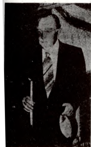
BILDET: Den sør-afrikanske statsministeren Johannes Vorster inder sitt besøk i staten Israel i april 1976. Flere samarbeidsavtaler mellom de to rasistregimene ble undertegnet under besøket

– Vi trenger hverandre. Dette sier en sør-afrikansk minister om staten Israel. Krake søker make! Sør-Afrika og Israel – det er begge stater som er bygget på rasisme.