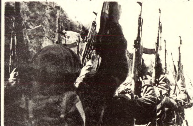
Folket i Norge må lære av folka i Vietnam, Kampuchea og Palestina. Også vi må velge folkekrigens vei mot imperialismen.

AKP(ml)s linje er at en supermaktsokkupasjon av Norge må møtes med aktiv motstand, og at vår oppgave er å gjøre krigen til en nasjonal-revolusjonær krig mot okkupasjonsmakten. Målet for denne krigen vil i første omgang være å hive ut okkupasjonsmakten for så å styrke borgerskapet og opprette proletariats diktatur. I denne kampen kan vi ikke støtte oss på en av supermaktene mot den andre, vi må velge