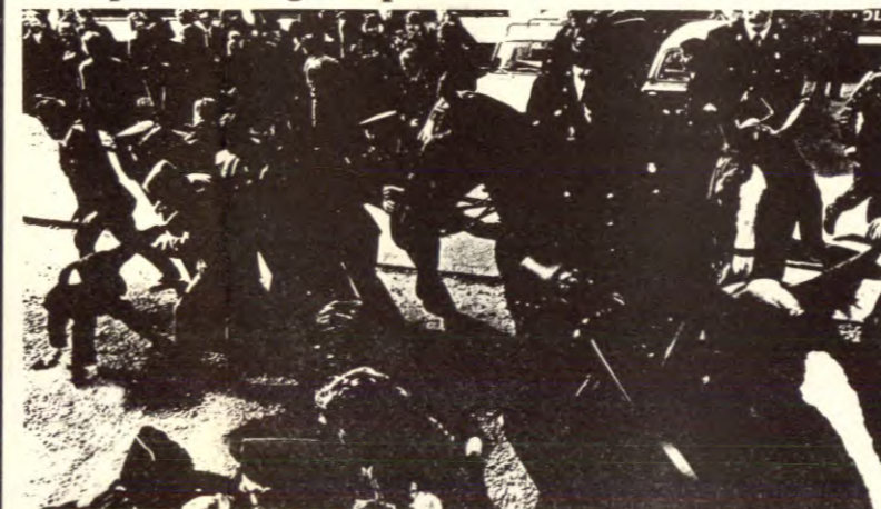
«Bak enhver streik lurer revolusjonens uhyre.» sier Lenin. Linjegodsarbeiderne og andre som har vært i streik har gjennom det lært mye om statens og voldsapparatets rolle.

Å bare sloss for forbedringer under kapitalismen, er reformisme. Å ikke sloss for forbedringer og mot undertrykking under kapitalismen er å svike arbeiderklassen og alle undertrykte. Bare med ei korrekt analyse av forholdet mellom dagskampen og kampen for sosialismen kan vi seire i kampen mot borgerskapet.