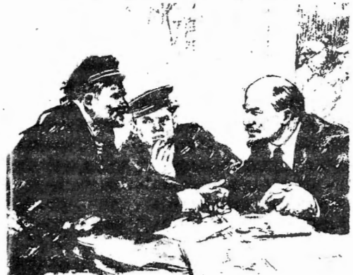
Lenin mot «marxisme» i ord, opportunisme i handling