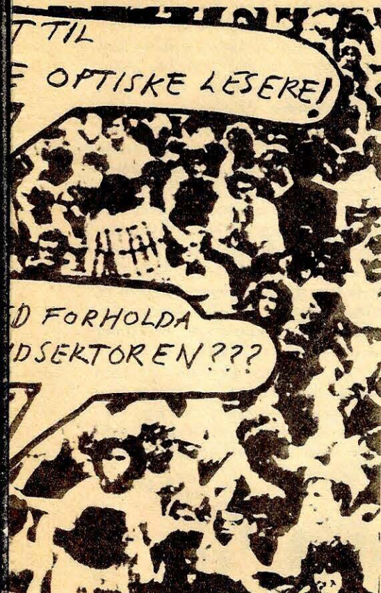
te i en storforening!

minimal opplæring, som flyr spissrot mellom elektroniske maskiner som spyr ut ferdige trykksaker.