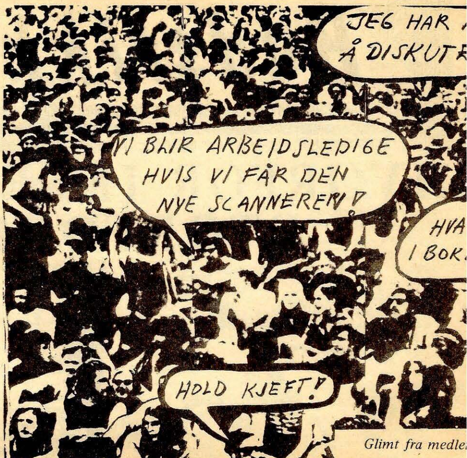
Glimt fra medle

Vi vet at den tekniske utviklinga truer oss og våre arbeidsplasser. Hver dag forskes det intenst i nye maskiner og metoder som vil kunne bli en trussel mot vår faglige status, våre jobber og lønninger. Typograffagets triste utvikling er kjent for de fleste, men vi må ikke tro at den faglige raseringa stopper der. Den vil gjelde oss alle. For finnes det maskiner som gjør jobben billigere, så finnes det også arbeidsgivere som vil kjøpe dem. Om det betyr resering av gamle håndverk eller oppsigelser av folk bekymrer ikke arbeidsgiverne. Tvert imot. Heldigvis er få fagorganiserte blåøyde når det gjelder disse tingene.