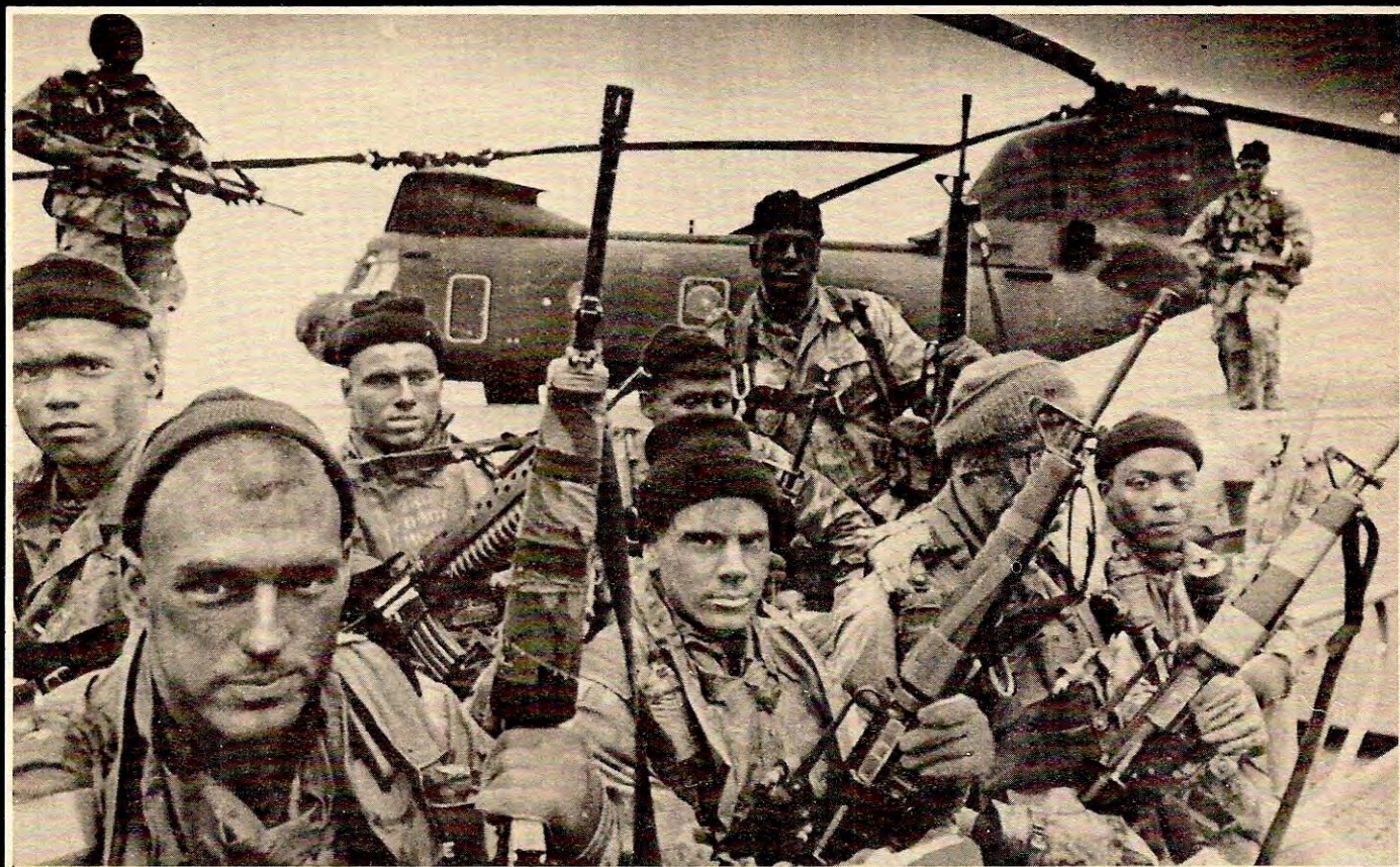
U.S. Marines i aksjon under «Teamwork 80». AKP (m-l) mener at sovjetisk opprustning må møtes med et styrket norsk forsvar, ikke forhåndslagring for U.S. Marines fra USA.