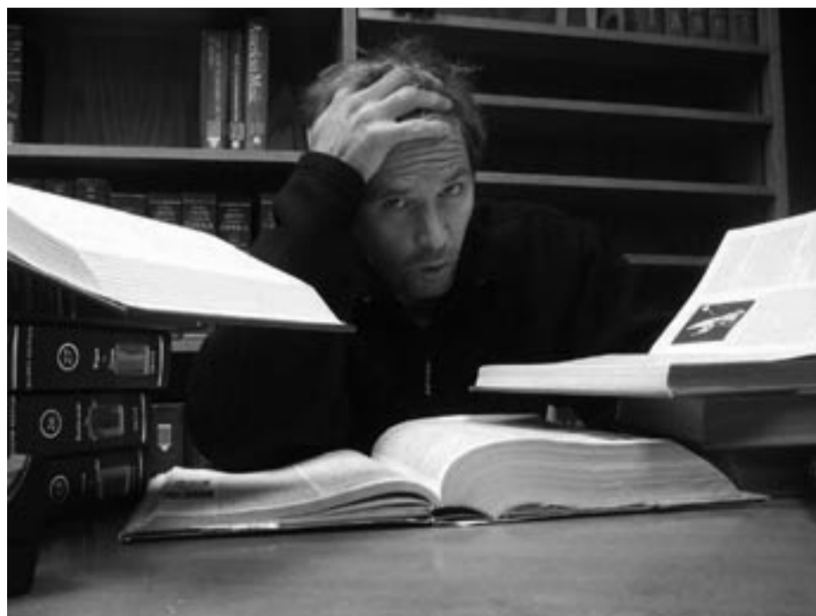
To dager til eksamen, mye igjen å lese + overtid på jobb.

Les vårt hefte «Forsvar høgskoler og universitet!». Du finner det på http://www.akp.no/rfane/2003/O2b/index.html