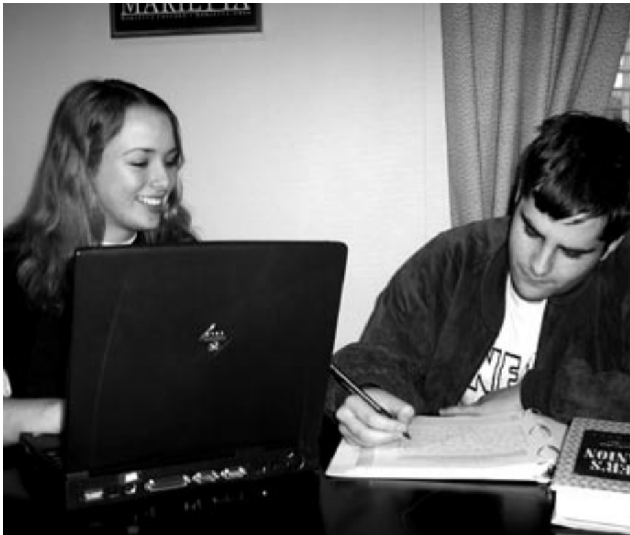
Glade studenter etter første møte på studiesirkel.

Studentenes individuelle valg av arbeidsform er også redusert. Foretrakk en før å jobbe på egen hånd i stedet for å gå på forelesninger (fordi en bodde langt unna studiestedet, forelesningene var dårlige eller en var avhengig av barnepass etc, det er mange grunner), så kunne en det. Nå er det krav om obligatorisk oppmøte på mange studier, og også krav om innlevering av obligatoriske oppgaver gjennom semes-