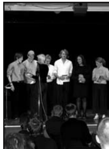
Teatergruppa Skyld og Skam underheldt på laurdagskvelden.