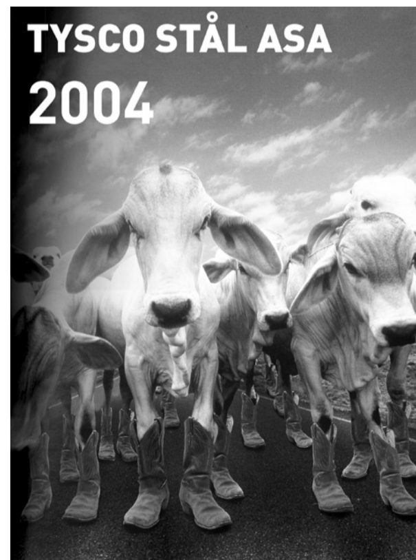
Ser vi slike kalenderbilder neste år?

samarbeidsavtale om likestilling i arbeidslivet. Min utfordring til dem: Hva har dere tenkt å gjøre med dette? Det skal ikke være sånn at det er opp til hver enkelt kvinne om hun orker å tåle hetsen som ofte følger ved å ta opp dette spørsmålet på arbeidsplassen, eller om hun skal ta på skylap-