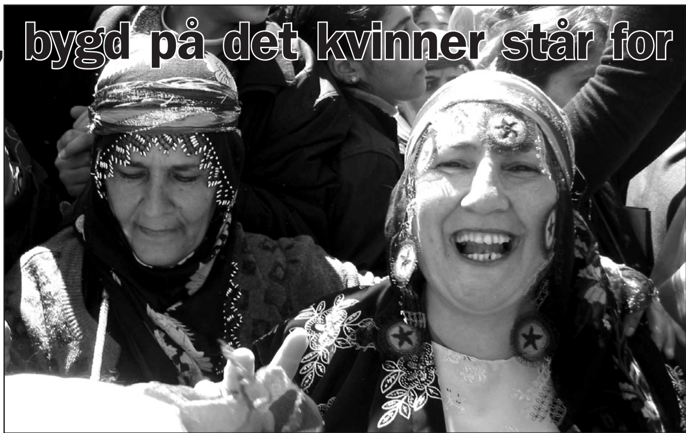
Dobbel okkupasjon. Newroz-festens hovedparole Kvinnen er frihetens hemmelige hage utfordra både den tyrkiske staten og tradisjonell kurdisk mannspekt.

– Utgangspunktet vårt er at kvinner kan oppnå frihet ved å utvikle seg sjøl fra der de er nå, at vi sammen gjør noe med de daglige problemene vi har