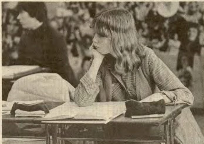
Ledelsen i NGS passiviserer grunnplanen.

sjokkbudsjett for elever og lærere. NGS stilte ingen krav på forhånd og de forberedte heller ikke elevene på aksjoner. De ble passivt med på tretti-merstreiken som alle elevorganisasjonene vedtok i sitt kontaktutvalg (DUK). Da