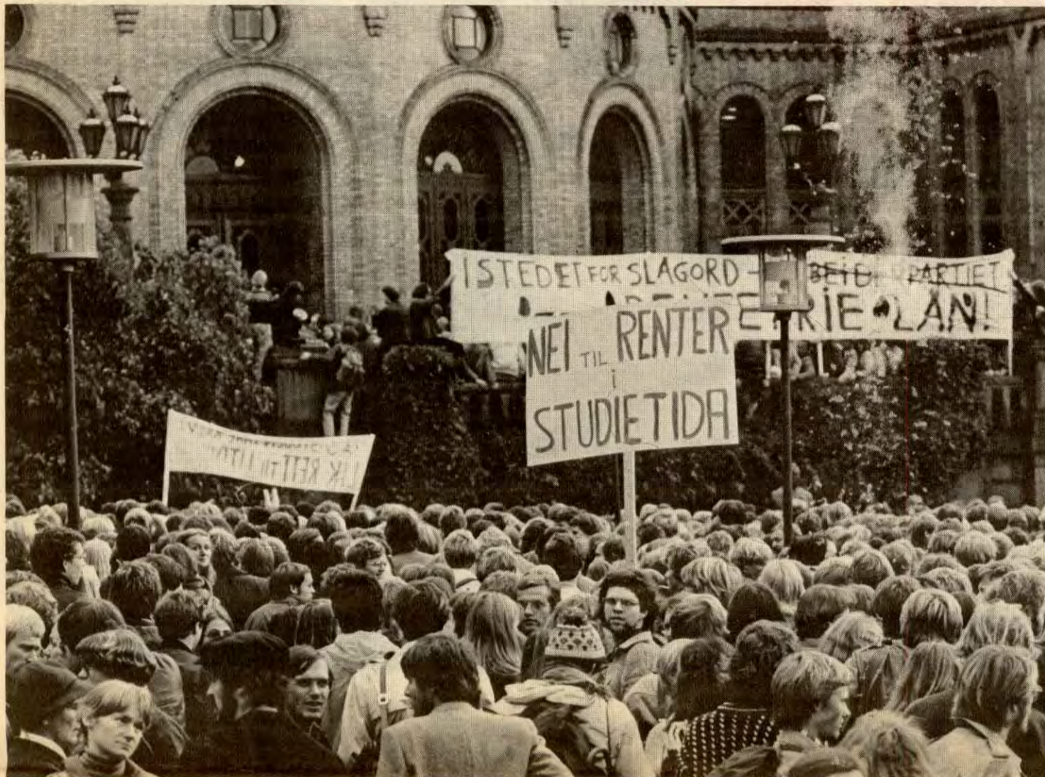
Kamp nytter! Etter kraftige reaksjoner fra elever og studenter i høst ble forslaget om renter i studietida trukket.

penga skal tas fra forsvarsbudsjettet. Dels er dette en feil parole å stille i ei førkrigstid. Men først og fremst fører det til å dreie debatten vekk fra nedskjæringene og over på en forsvarsdebatt. Dette er helt i tråd med SU's fraseradikale linje ellers i skolekampen. SU's arbeid i