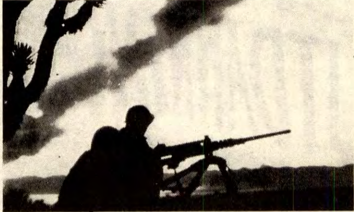
Kapitalismen er et døende samfunnsystem.

Vi lever i en syk verden! Vi kan ikke bare se på den norske idyllen idag, for idyllen kan ikke vare. Norge er avhengig av resten av verden. Hele den rike verdens rikdom er bygget opp på den mest hensynsløse undertrykking av den 3. verden. Det begynte med slavehandel, fortsatte med kolonier og holder det gående idag med økonomisk utbytting. Verden har nok mat til alle, men 2/3 sulter fortsatt.