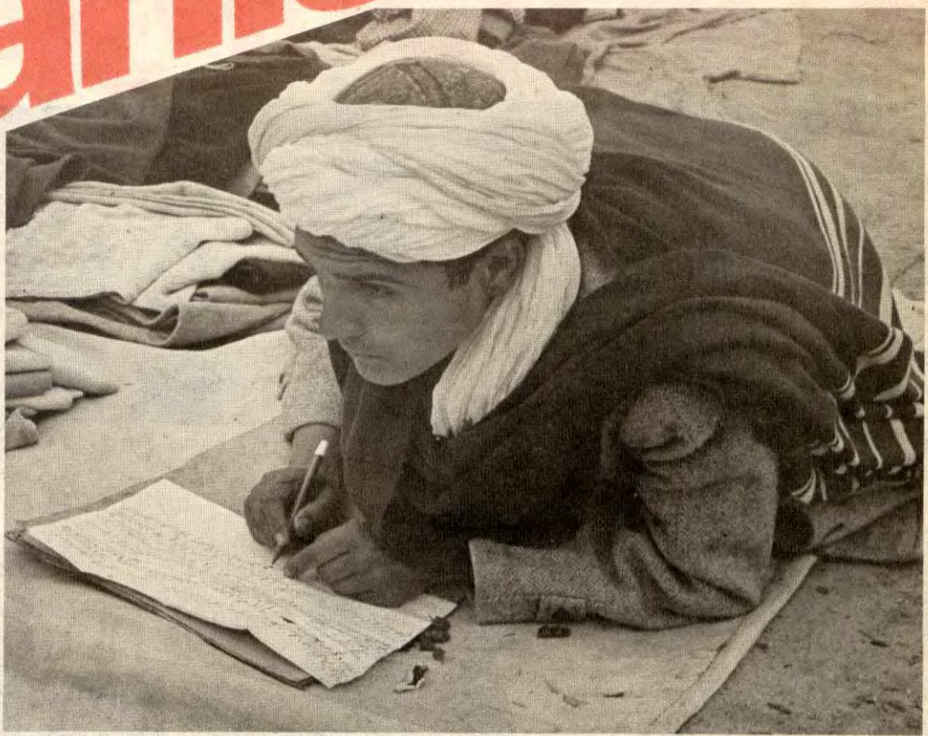
Hele 80% av Afghanistans befolkning er analfabeter. Flyktingestrømmen invasjonen skapte har gjort problemet enda større. De få som kan lese og skrive må hjelpe dem som ikke kan når det trengs, sånn som denne mannen på torget i Herat. Utdanning og kunnskap er en forutsetning for frigjøring, og for gjenoppbyggingen av landet når det engang blir frigjort.

● I flyktingeleirene har nærmere 50% tuberkulose. Mange er helt avkrefta av flukten og kulden. Ca. 95% er analfabeter. — Skal vi vi dem håp? Skal vi gi dem utdanningsmuligheter? Skal vi være med på å legge grunnlaget for oppbygginga av et fritt, selvstendig Afghanistan.