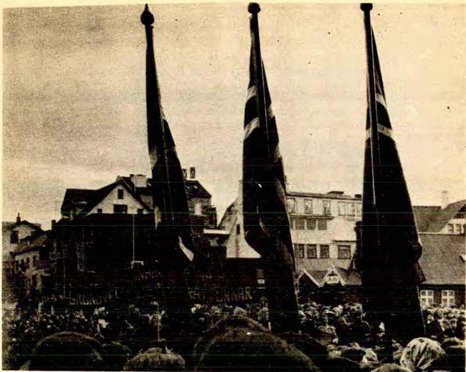
Fra et demonstrasjonstog i Reykjavik