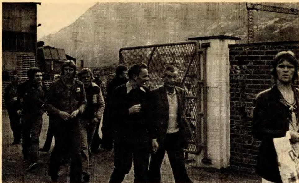
Zinken-arbeiderne har vedtatt streik og forlater jobben.

belgiske «Compagnie Royale Austurienne des Mines», har tatt rett ut av landet. A/S NORZINK betaler f.eks. ikke et øre i skatt til Odda kommune.