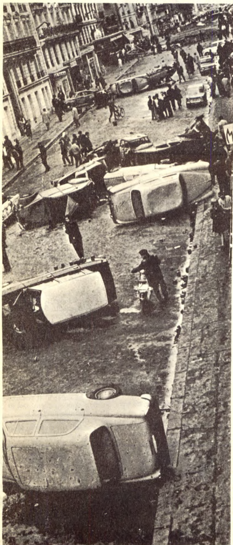
Dersom revisjonisme, og ikke kommunisme, står sterkt i massene, ledes kampen på avveier. Bildet er fra Paris i mai 1968.

Et annet og mer "raffinert" angrep på dagskampen er representert av KUL-gruppa. Denne gruppa propaganderer den borgerlige og økonomistiske illusjonen at dagskampen i seg sjøl får en revolusjonær karakter straks den setter seg ut over "det borgerlige lovverket". De prøver å drive streikestøt-tearbeidet inn i et sektersk blindgate der kamp mot det de kaller "fagforeningslegalismen" er det sentrale, samtidig som de lar de borgerlige pampene og arbeideraristokratiet gå skuddfri. Dette er en høyreorientert sektersisme som ikke må få skade streikestøt-tearbeidet.