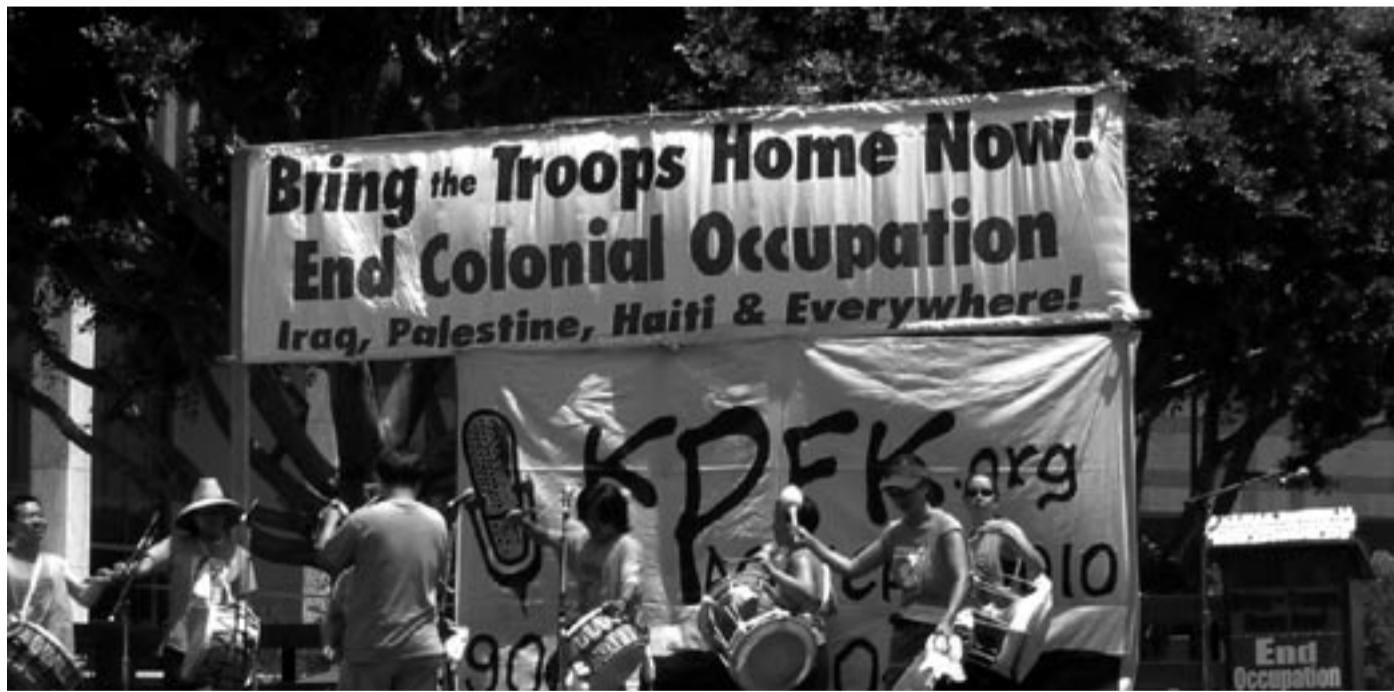
Krigsmotstanden finnes overalt

De norske bidraga til okkupasjonen av Irak og Afghanistan må opphøre. Men også Nato-medlemskapet må settes på dagsordenen igjen. Fordi vi ser at det er «Nato-sporet» som drar Norge inn på USA-laget. Hvis ikke, blir det vi oppnår, bare kosmetiske endringer, mens vi blir med på ferden med «hovedkursen liggende fast», som regjeringa sier.