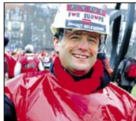
Over: Bilder fra demonstrasjon i Strasbourg mot EUs tjenstedirektiv. Venstre: Fritz Bolkestein er mannen bak EUs tjenstedirektiv. Her er en demonstrasjonsplakat fra Frankrike, der Bolkestein er tegna som monstret Frankenstein.