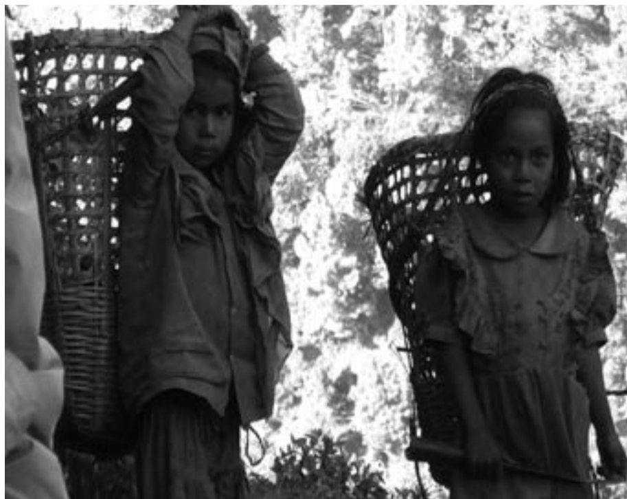
1,2 milliarder mennesker i verden lever i ekstrem fattigdom. Kapitalismen og imperialismen tar livsgrunnlaget fra folk. Bildet viser nepalske barnebønder.

Det som drev oss, var et ubendig ønske om å gjøre slutt på utbytting og undertrykking, imperi-